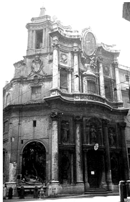
Il Gesu Rome