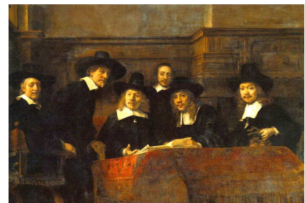
Rembrandt van Rijn: de staalmeesters 1662