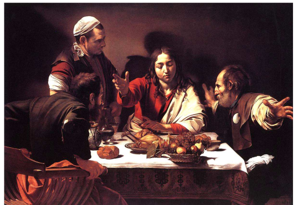
Caravaggio de Emmausgangers