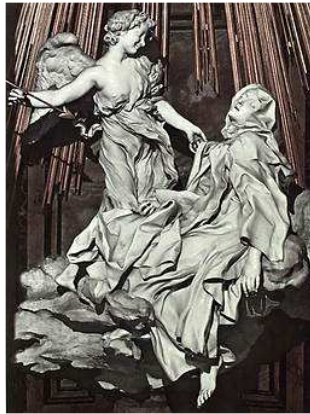
Bernini de extase van St Theresa