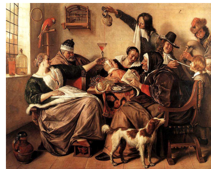
genrestuk: Jan Steen vrolijke familie