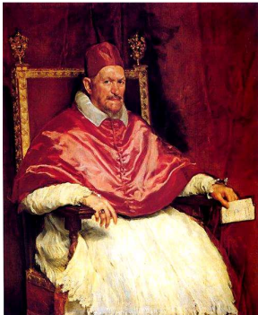
Diego Velasquez Paus Innocenti